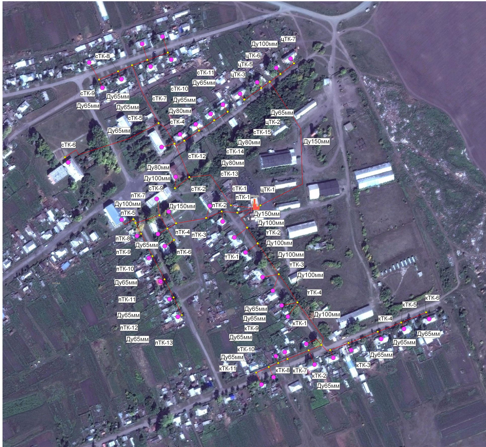
Рис.2.1 Схема теплоснабжения муниципального образования с. Козиха от котельной .