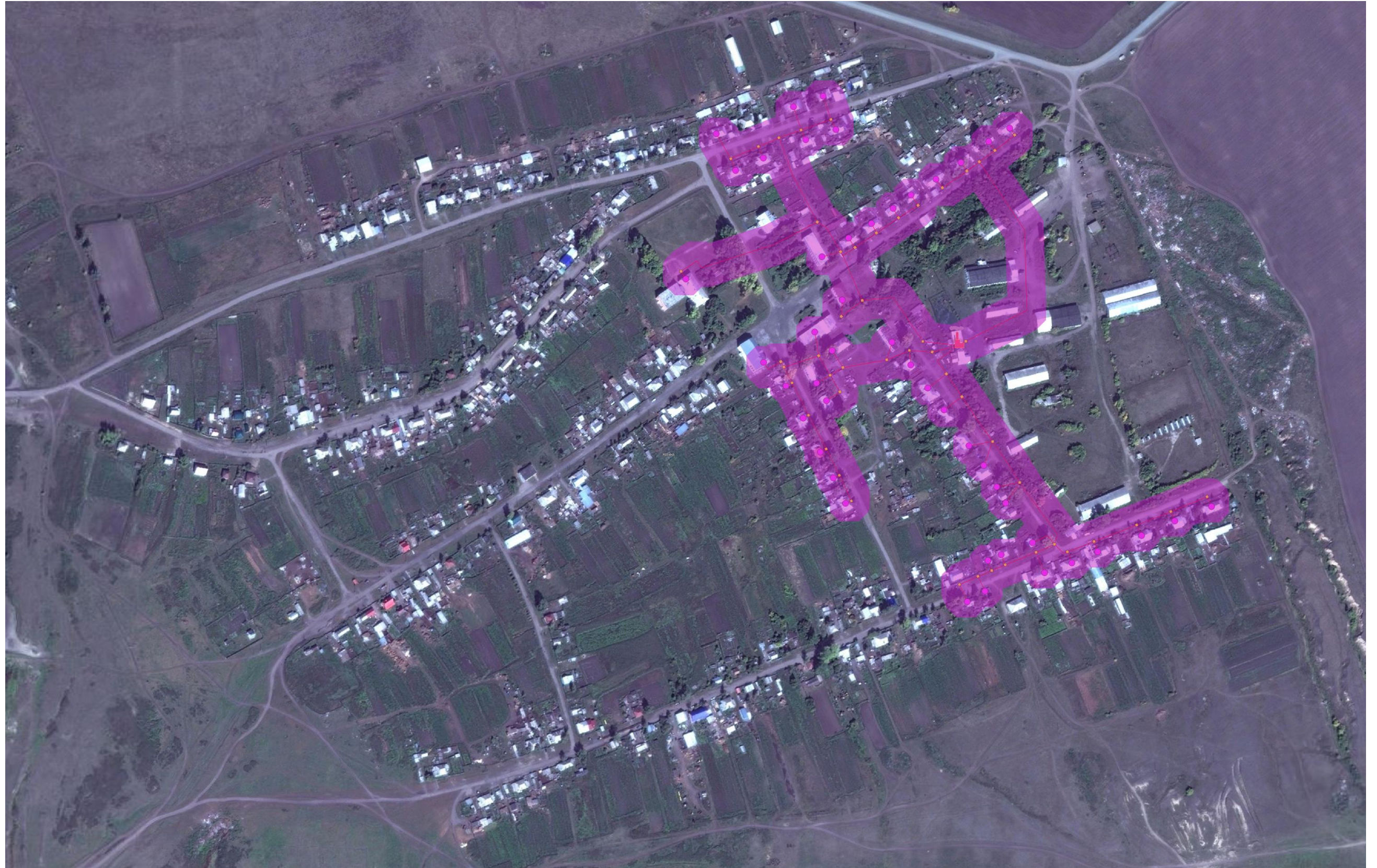
Рис. 9.1 – Схема теплоснабжения с. Козиха от котельной.